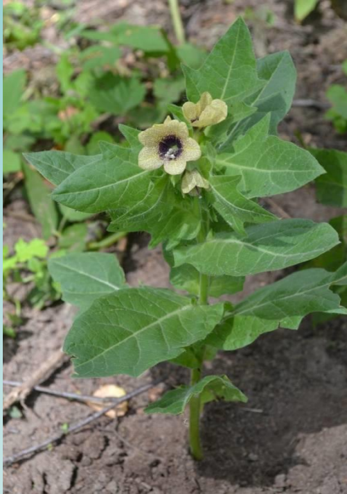
black henbane ( Hyoscyamus niger )