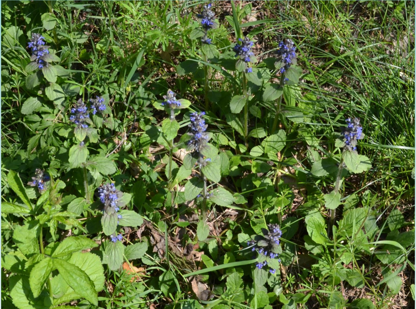
Bugle – Ajuga reptans