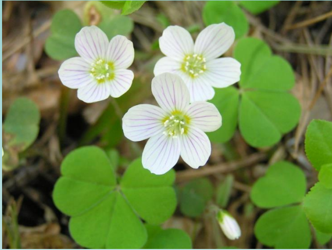
wood sorrel (Oxalis acetosella)