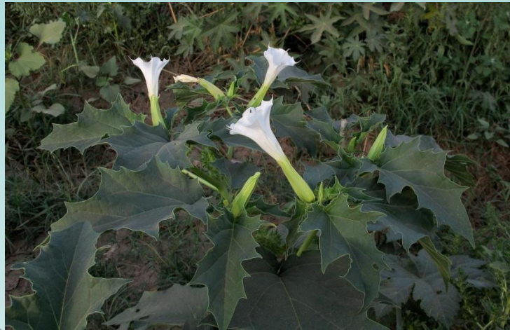
jimsonweed ( Datura stramonium )