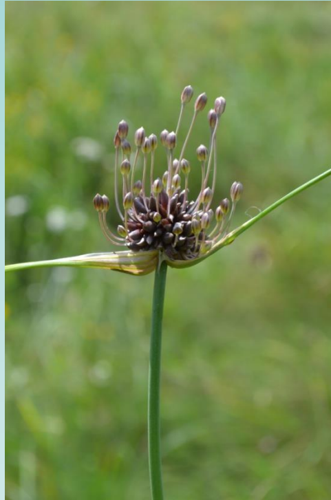
potherb onion (Allium oleraceum )