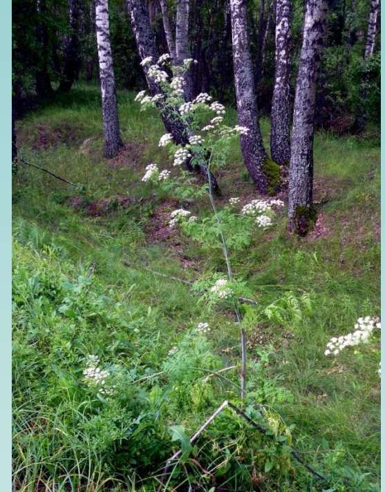
hemlock ( Conium maculatum )